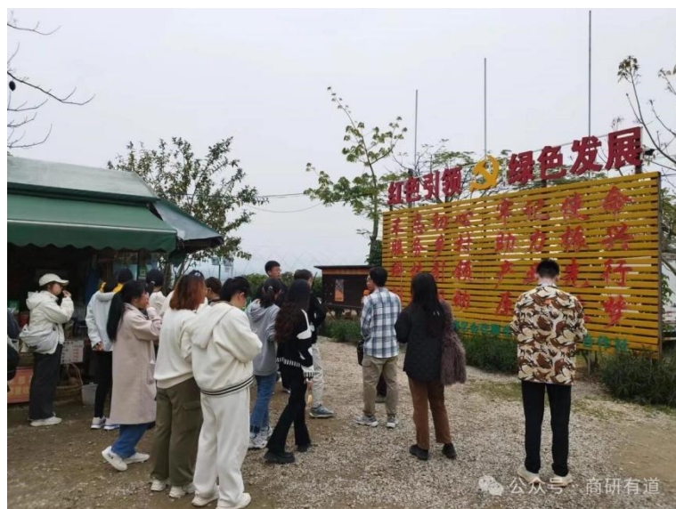
商学院师生前往金佳顺生态种养专业合作社和前美村进行研学活动

为拓宽研究生视野，学习乡村振兴落地成果，2024 年 3 月 16 日，商学院组织师生 40 余人前往金佳顺生态种养专业合作社和前美村进行研学活动，通过亲身体验农作物种植和农耕活动，开阔视野。在研学中，师生们实地学习了依托绿色生态资源，因地制宜开展现代农业复合发展的模式，参观和学习成功的乡村振兴案例，从书斋走进田野，体验了“百千万工程”典型村乡村振兴和农村现代化的最新成果，更有利于同学们增加见识阅历、拓宽研究思路、增进历史理解，推动农业教育和可持续发展的进步。