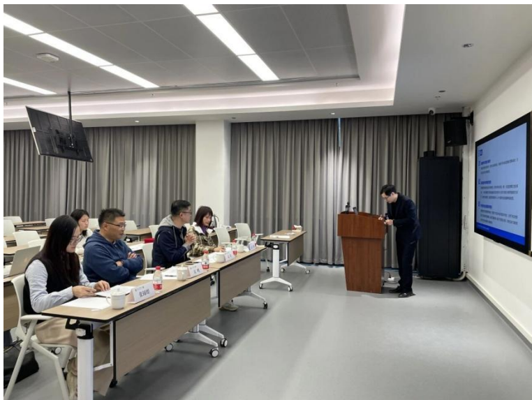
评委结合教师教学创新成果报告和现场汇报表现作出点评

师教学创新成果报告和现场汇报的表现与参赛教师进行深入交流，并作出精彩点评，为参赛教师进一步完善教学创新成果报告和现场汇报、深入挖掘和融入课程思政元素、开展教学改革创新、提升课程教学效果等方面提出了宝贵的意见和建议。