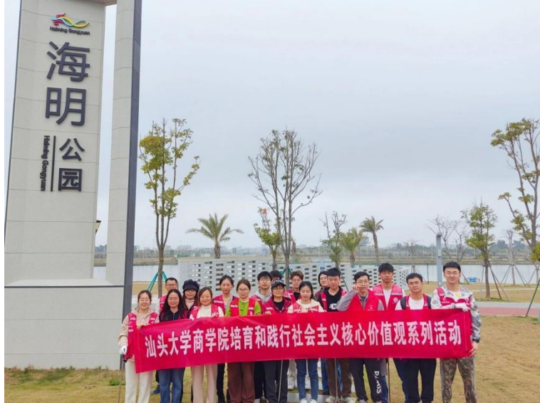
商学院研究生学生会开展“清捡垃圾美环境，共筑绿色东海岸”主题志愿服务活动

为拓宽研究生视野，学习乡村振兴落地成果，2024 年 3 月 16 日，商学院组织师生 40 余人前往金佳顺生态种养专业合作社和前美村进行研学活动，通过亲身体验农作物种植和农耕活动，开阔视野。在研学中，师生们实地学习了依托绿色生态资源，因地制宜开展现代农业复合发展的模式，参观和学习成功的乡村振兴案例，从书斋走进田野，体验了“百千万工程”典型村乡村振兴和农村现代化的最新成果，更有利于同学们增加见识阅历、拓宽研究思路、增进历史理解，推动农业教育和可持续发展的进步。